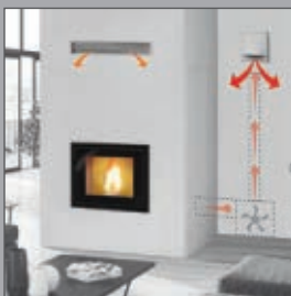
KIT AIR DIFFUSER

CANALIZABLE_CANALIZÁVEL ΠΑΡΟΧΗ ΘΕΡΜΟΥ ΑΕΡΑ_DUCTABLE