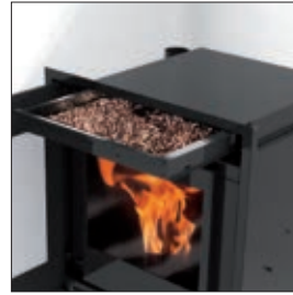
Cajón pellet Gaveta para pellets Συρτάρι φόρτωσης pellet Loading with frontal load tray