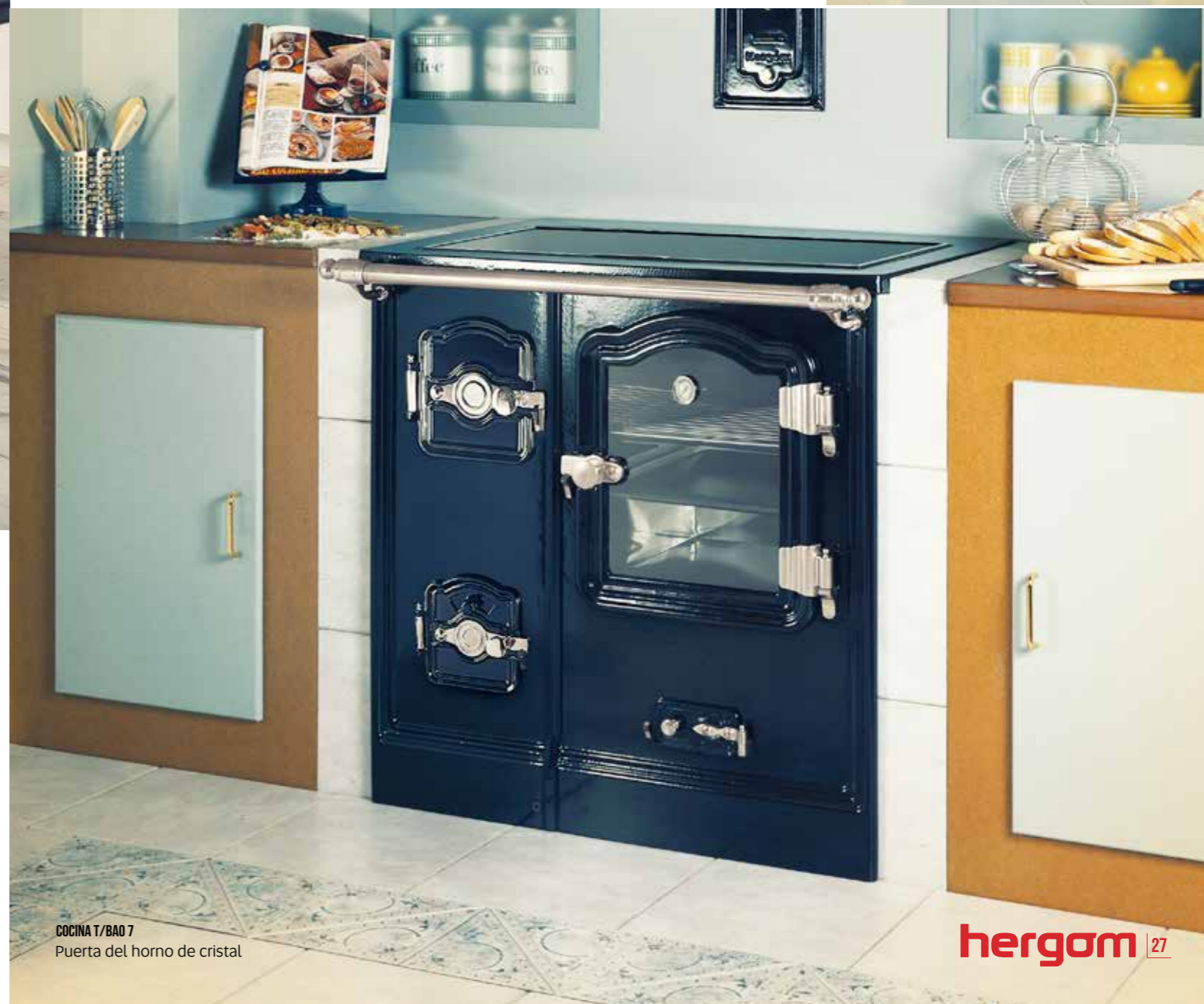
COCINA T/BAO 7 Puerta del horno de cristal