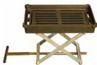
Elevador de parrilla de serie en todos los modelos L-07 calefactora