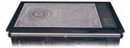
ENCIMERA PULIFER. Hierro fundido pulido, con arandelas