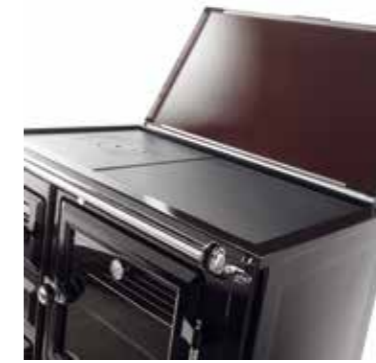
Encimera vitrocerámica practicable con bajoencimera de hierro fundido.

Opciones de encimera: Vitrocerámica practicable o hierro fundido pulido Dimensiones (An. x AL. x P.): 870 x 850 x 600 Herrajes: Cromo Material horno: Acero inoxidable