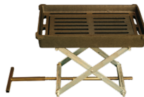
Elevador de parrilla

Potencia nominal: 20,2 kW Potencia cedida al agua: 15,7 kW Rendimiento: 76,5% Opciones de encimera: Vitrocerámica practicable Dimensiones (An. x AL. x P.): 1.000 x 850 x 600 Herrajes: Cromo Material horno: Acero inoxidable