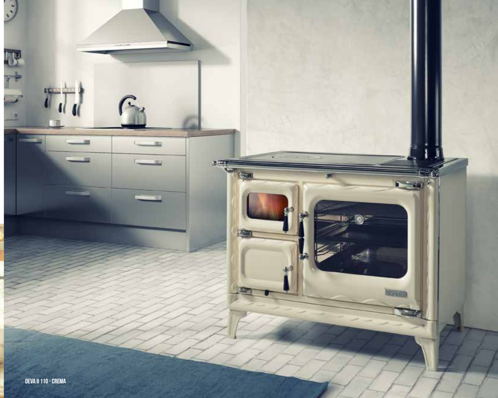
DEVA II 110 - CREMA