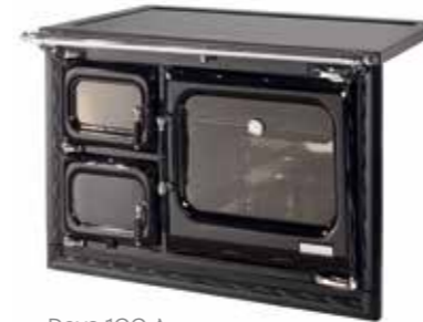
Deva 100 A con altura de 75 cm