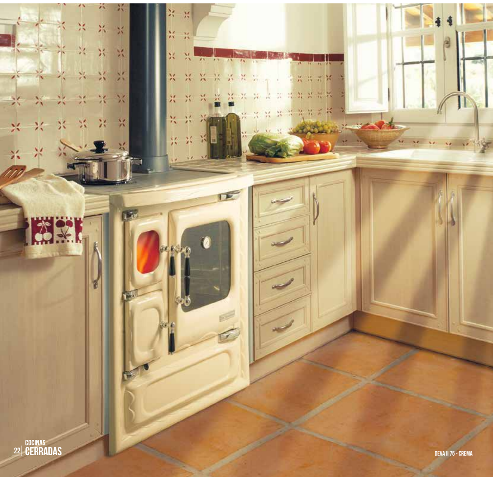
DEVA II 75 - CREMA

Opciones de encimera: Hierro fundido pulido Dimensiones (An. x AL. x P.): 785 x 850 x 600 Herrajes: Cromo Material horno: Acero inoxidable