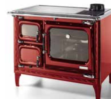
Deva II 100 Burdeos