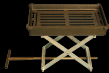
Elevador de parrilla

Potencia nominal: 35,3 kW Potencia cedida al agua: 28,7 kW Rendimiento: 76,9% Opciones de encimera: Hierro fundido pulido Dimensiones (An. x AL. x P.): 1.100 x 850 x 680 Herrajes: Latón Material horno: Acero esmaltado Dispone de elevador de parrilla