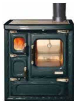
Deva II 75 Negro brillo