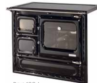
Deva 100 A con kit de altura de 85 cm