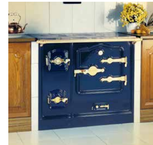
COCINA T/BAO 8 Puerta del horno de hierro fundido

Opciones de encimera: Vitrocerámica practicable, 60 cm de fondo Vitrocerámica no practicable, 55 cm de fondo Hierro fundido pulido Dimensiones T/BAO 7 (An. x Al. x P.): 840 x 850 x 520 T/BAO 8 (An. x Al. x P.): 955 x 850 x 550 T/BAO 9 (An. x Al. x P.): 1.050 x 850 x 550 Disponibles también en altura de 750 mm Herrajes: Latón (con puerta de horno sólida) o cromo (puerta de horno acristalada) Material horno: Modelos puerta ciega, acero esmaltado (opcionalmente inox.). Modelos puerta de cristal, acero inox.