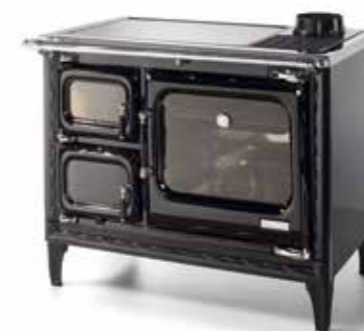
Deva II 100 Negro brillo