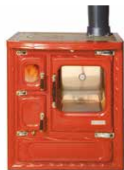
Deva II 75 Burdeos