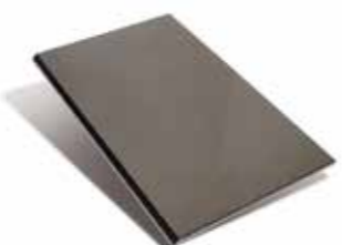
Cubreencimera de acero esmaltado opcional para modelos con encimera clásica