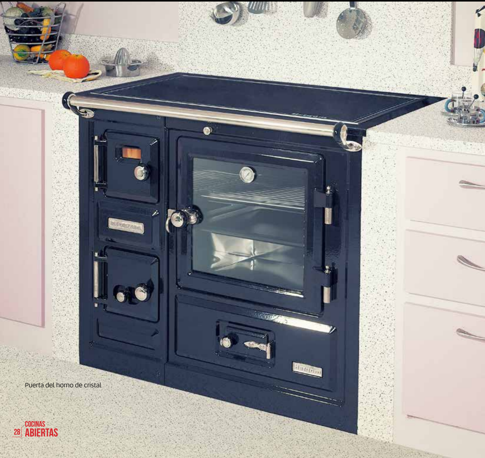
Puerta del horno de cristal