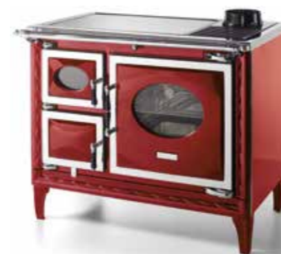
Nansa II Burdeos

Vitrocéramica o hierro fundido pulido Dimensiones (An. x AL. x P.): 1.025 x 850 x 600 Herrajes: Cromo Material horno: Acero inoxidable Colores: Negro, Burdeos y Crema