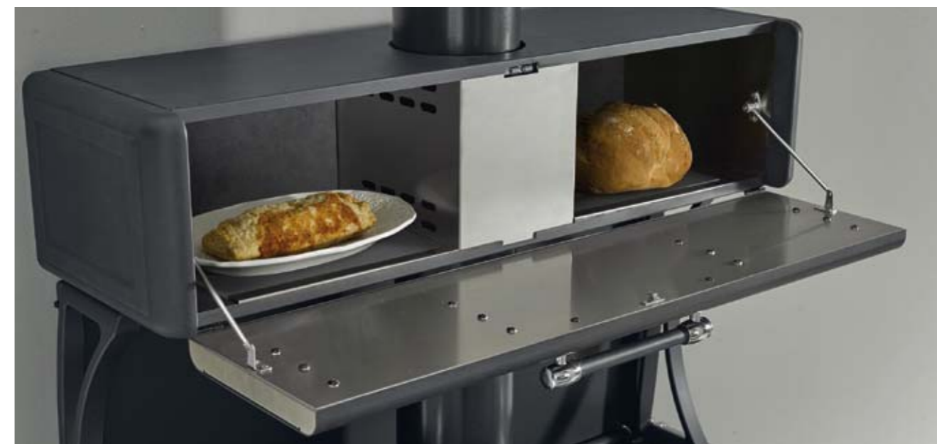
Scaldavivande (optional): Interno in pietra lavica ed acciaio inox per uso alimentare