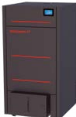
HYDROCONFORT-27 Versão com limpeza automática.