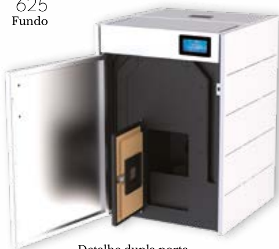
Detalhe dupla porta.

Sugestão de instalação em armário de cozinha.