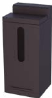
Detalhe tanque pellet opcional.