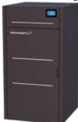
HYDROTEX-27 Versão sem limpeza automática.